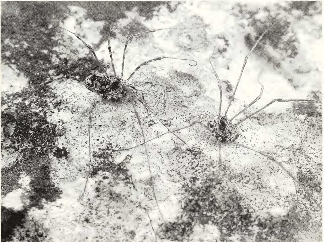
Abb. 2: Geschlechtsdimorphismus bei Megabunus lesserti . Weibchen (links) und Männchen (rechts) von Lunz, Niederösterreich.

Totes Gebirge. NW Abfall Elm, 500 m SW Pühringer Hütte, ca. 1700 m, 47°41' N, 13°57' E, Kalkfelswand im Latschengürtel, nur an feuchten, überrieselten Stellen, 11 ♀♀, 3 juv., 21. Juni 2005, leg. CM/BS. Mürzsteiger Alpen. Oberes Mürztal, W Wasserfall zum Toten Weib, S Frein a. d. Mürz, 855 m, 47°43' N, 15°29' E, Kalkfelswand in feuchter Klamm, 8 ♀♀, 15. Juni 2005, leg. CM/BS, Bestätigung des Fundortes von E. Kreissl 1988 (KOMPOSCH 1998). Hochschwabgruppe. Vorderberger Griesmauer oberhalb Leobner Hütte, 1850 m, 47°32' N, 14°58' E, Felsbereiche oberhalb Waldgrenze in S-Exposition, 1 ♂ 3 ♀♀, 20. Juni 2005, leg. CM/BS. Ennstaler Alpen. Gesäuse, oberhalb Oberst-Klinke-Hütte, S-Abfall Kalbing, ca. 1800 m, 47°32' N, 14°31' E, kleine Felswände und Kalkblöcke in Grasheide, 4 ♂♂ 12 ♀♀, 19. Juni 2005, leg. CM/BS. - Nationalpark Gesäuse, Sulzkarhund